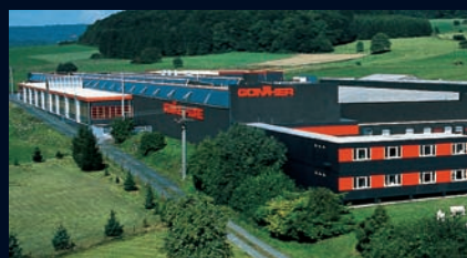
Główna siedziba przedsiębiorstwa w Neunkirchen

Günther-Tore GmbH Dr.-Wolfgang-Günther-Str. 3-7 D-56479 Neunkirchen Tel. +49 (0) 64 36/601-0 Fax +49 (0) 64 36/601-130 www.guenther-tore.de info@guenther-tore.de